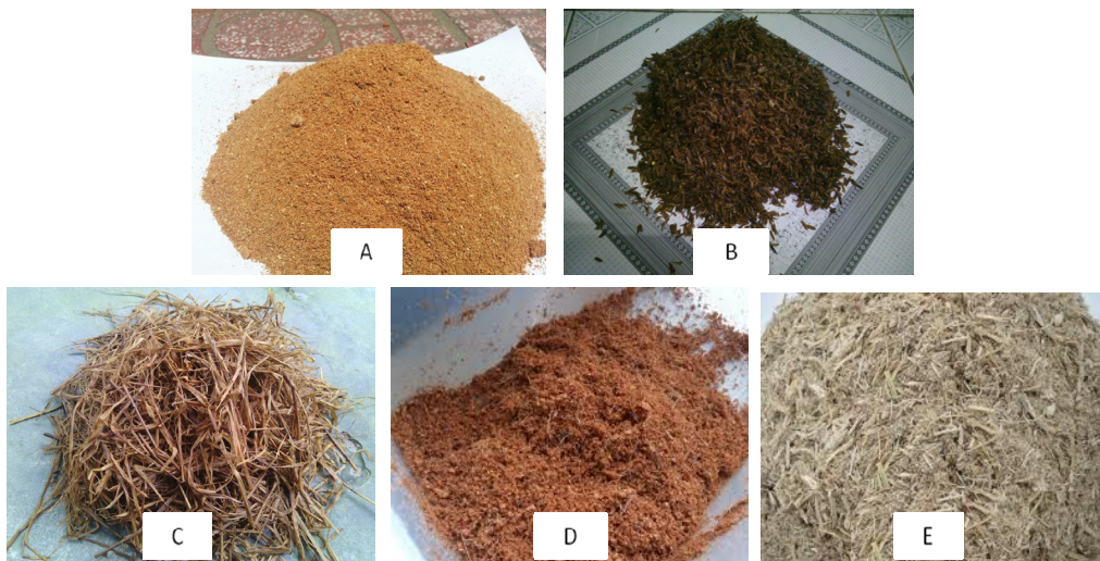
Hình 1: Các loại cơ chất sử dụng trong thí nghiệm mùn cưa (A), trấu (B), rom (C), mụn dừa (D) và bã mía (E)

Meo giống nấm bào ngư xám ( Pleurotus sajor - caju ) và mùn cưa (Hình 1 A) được cung cấp từ doanh nghiệp tư nhân Năm Việt, tại Quận Bình Thủy, thành phố Cần Thơ). Rom rạ, bã mía, trấu và mụn dừa được mua từ địa phương (Hình 1).