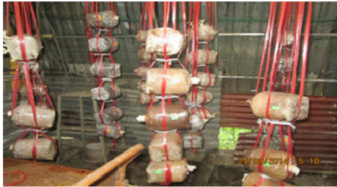
Hình 2: Các túi phân được treo bằng dây nylon trong nhà nuôi trồng

Trước khi đưa nấm vào nhà nuôi trồng, khu vực nền được khử trùng bằng vôi bột ( 100 \text{ g/m}^2 ). Theo điều kiện của nhà nuôi trồng và để dễ dàng cho việc vệ sinh và tiết kiệm chi phí nên các bịch phân nấm được treo bằng dây nylon với các hàng cách nhau 35 cm, để tránh các bịch va chạm làm hư tai nấm sau này (Hình 2). Khi tơ nấm đã lan đầy bịch phân thì tiến hành gỡ nút bông khỏi miệng bịch và tưới đốn nấm. Nước tưới phải sạch, không phèn, dùng bình phun sương thật mịn, tưới bình quân 3 - 4 lần/ngày. Sau khoảng 5 - 7 ngày tưới đốn, nấm sẽ ra quả thể. Thu hoạch lúc tai nấm ở dạng lá lục bình, hái tai nấm hết cả chùm, không được để sót lại phần chân nấm vì nó dễ gây nhiễm, ảnh hưởng đến những lần thu sau.