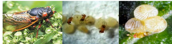
Hình 2. Một số hình ảnh ong mắt đỏ và hiện tượng kí sinh trùng trong tự nhiên

Ví dụ: Quan sát hiện tượng sinh sản ở ong mắt đỏ (hình 2). Ong mắt đỏ là các loài kí sinh trùng đóng vai trò quan trọng trong việc điều hòa số lượng sâu hại ngoài tự nhiên. Từ lâu, ong mắt đỏ được sử dụng như biện pháp chính để diệt trừ một số loài sâu hại như sâu đục thân ngô, sâu cuốn lá lúa, sâu tơ, sâu róm thông. Quan sát trong tự nhiên thấy hiện tượng ong cái đẻ trứng sau khi thụ tinh vào trong cơ thể sâu đục thân. Đến khi trứng nở, cá thể con sử dụng nguồn dinh dưỡng từ chính cơ thể sâu đục thân để phát triển. Kết quả làm cho sâu đục thân bị chết: - Cơ sở khoa học của việc ứng dụng hiện tượng này là gì? - Nghiên cứu hiện tượng trên có ý nghĩa gì trong trồng trọt? - Ý nghĩa của hiện tượng này trong việc bảo vệ môi trường là gì?