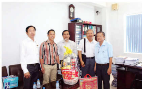
Thăm và chúc tết Công ty CP&TV Phát triển hạ tầng ADICO An Giang