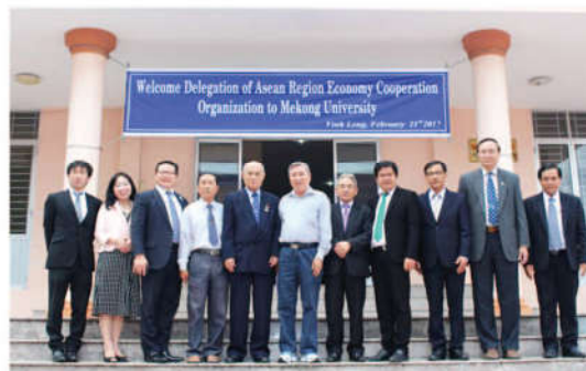
Hai bên giao lưu tặng quà và chụp ảnh lưu niệm

Với những nội dung ký kết cơ bản, hy vọng hai đơn vị trong thời gian sắp tới sẽ xây dựng nên những chương trình hoạt động thiết thực, mang nhiều ý nghĩa để hỗ trợ tối đa cho các bạn sinh viên về nơi thực tập cũng như nâng cao kỹ năng nghề nghiệp.