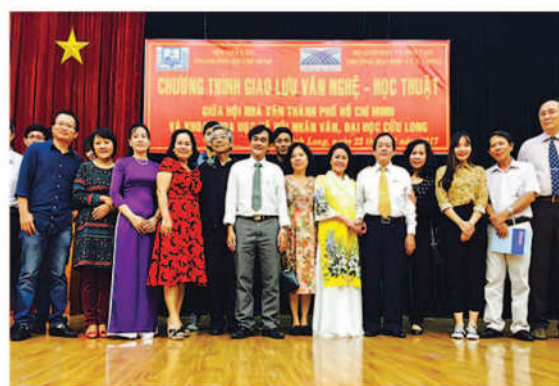
Đoàn nhà văn TPHCM chụp ảnh lưu niệm với thầy cô Đại học Cửu Long