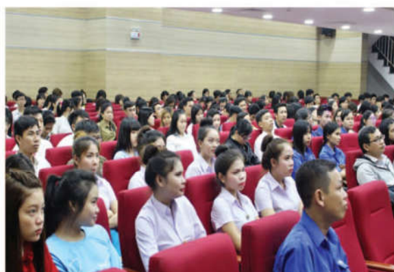
Chương trình thu hút đông đảo các bạn sinh viên đến tham dự