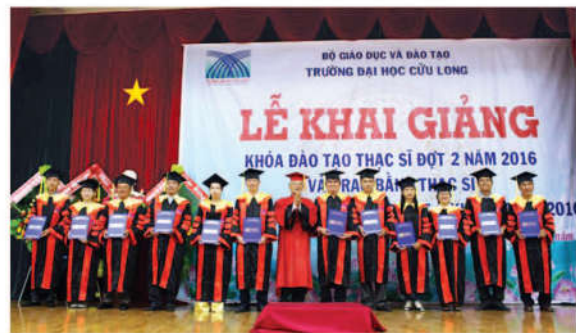
Trao bằng cho các tân thạc sĩ