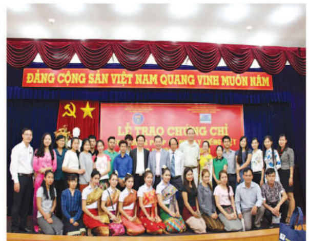
Các học viên, lưu học sinh Lào cùng chụp ảnh lưu niệm với lãnh đạo 2 đơn vị