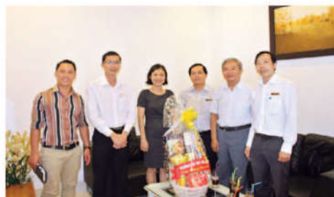
Thăm và chúc tết Công ty TNHH Toyota Cần Thơ