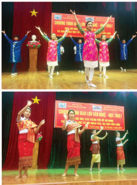
Các tiết mục múa của Đội văn nghệ Trường Đại học Cửu Long