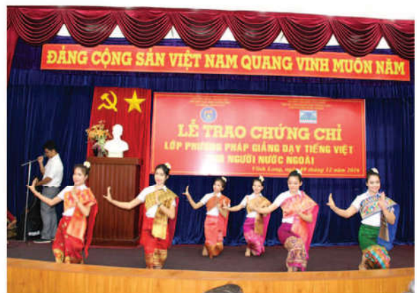
Các Lưu học sinh Lào múa chúc mừng kết thúc khóa học