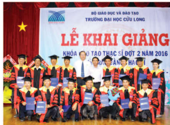
Các tân thạc sĩ ngành Kỹ thuật xây dựng công trình dân dụng & Công nghiệp chụp ảnh lưu niệm với lãnh đạo nhà trường