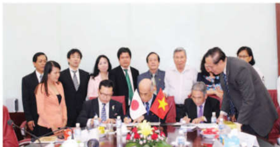
Hai bên tiến hành ký kết bản ghi nhớ hợp tác

Tại buổi làm việc, hai bên đã bàn bạc và thống nhất lập biên bản ghi nhớ về các nội dung cơ bản mà cả hai bên cùng quan tâm để hướng tới việc ký kết thỏa thuận hợp tác chính thức trong thời gian tới. Biên bản ghi nhớ gồm các nội dung cụ thể như sau: ARECO đào tạo nguồn nhân lực cho trường Đại học Cửu Long nói riêng và đồng bằng sông Cửu Long nói chung từ khâu đào tạo đến việc làm; ARECO hỗ trợ giảng viên khoa Khoa học nông nghiệp của trường Đại học Cửu Long về kỹ thuật bảo quản, chế biến nông sản; ARECO sẽ hỗ trợ trang thiết bị, phòng thí nghiệm phục vụ công tác giảng dạy và học tập tại trường Đại học Cửu Long; ARECO đầu tư phòng khám đa khoa tại Đại học Cửu Long; Trao đổi giảng viên giữa hai đơn vị thông qua học viên ngôn ngữ quốc tế KOBE; Chương trình hợp tác đưa sinh viên tốt nghiệp của trường Đại học Cửu Long sang Nhật Bản học tập nâng cao trình độ và làm việc; ARECO hỗ trợ xây cơ sở đào tạo tiếng Nhật tại Đại học Cửu Long.