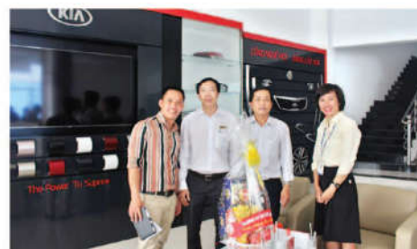
Thăm và chúc tết Công ty cổ phần kỹ thuật ô tô Trường Long – Vĩnh Long