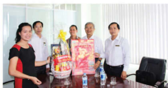
Thăm và chúc tết Công ty cổ phần GENTRACO - Thốt Nốt, Cần Thơ