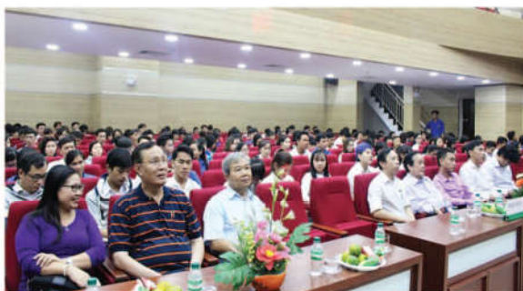
Đại diện khách mời, lãnh đạo nhà trường và các đơn vị tham dự chương trình