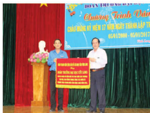
Tặng cờ thi đua đơn vị dẫn đầu khối ĐH – CĐ của tỉnh để tri ân Hội đồng quản trị và lãnh đạo nhà trường