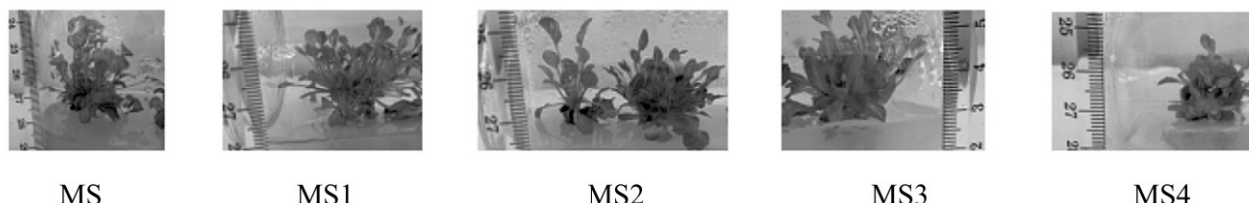
Hình 2. Chồi được hình thành từ mô sẹo hoa Đồng tiền in vitro

trường. Điều này cho thấy khi giảm nồng độ các thành phần môi trường MS ở nghiệm thức MS1 không làm ảnh hưởng đến sự sinh trưởng của chồi từ mô sẹo, nhưng ở MS2, MS3 và MS4 các chỉ tiêu số chồi và số lá hình thành kém do giảm quá nhiều nồng độ các thành phần cơ bản của môi trường nuôi cấy.