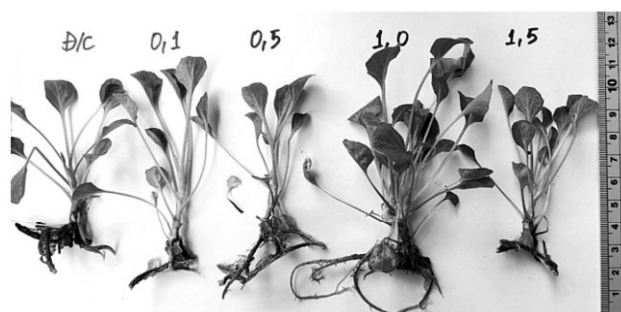
Hình 4. Cây con hoa Đồng tiền in vitro

Lời cảm ơn: Bài báo được hỗ trợ kinh phí thực hiện bởi đề tài cấp cơ sở “Hoàn thiện quy trình nhân giống hoa Đồng tiền ( Gerbera jamesonii ) và hoa Cát tường ( Eustoma grandiflorum (Raf.) Shinnery) bằng phương pháp nuôi cấy mô tại huyện Châu Thành, tỉnh Kiên Giang”.