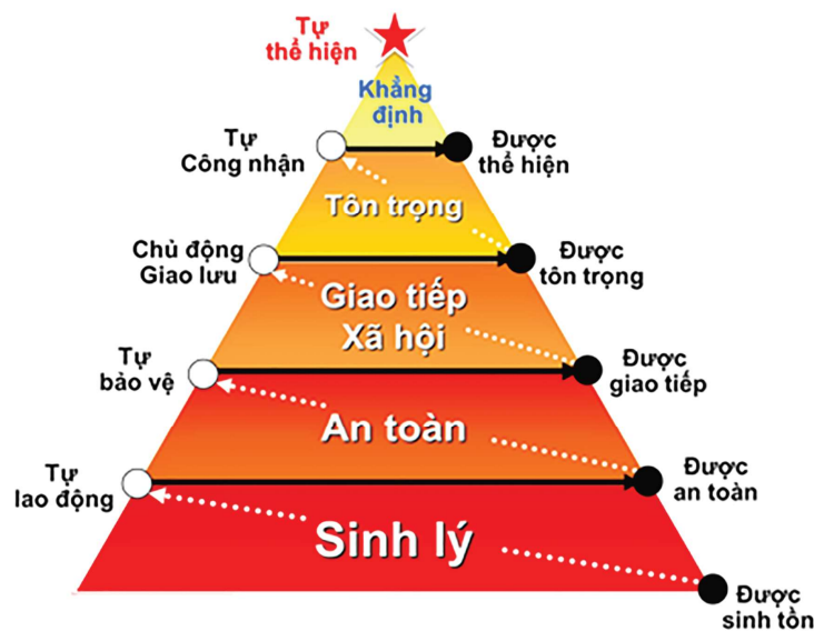
Hình 1: Tháp nhu cầu Maslow

Maslow cho rằng hành vi của con người bắt nguồn từ nhu cầu và những nhu cầu của con người được sắp xếp theo một thứ tự ưu tiên từ thấp tới cao. Theo tầm quan trọng, cấp bậc nhu cầu được sắp xếp thành năm bậc sau: