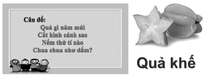
Hình 2: Minh họa bước 1

- GV: Đưa ra câu hỏi, phần nhiều được chuyển thành các câu đố đơn giản giúp tạo hứng thú, kích thích trí tò mò của HS (xem Hình 2).