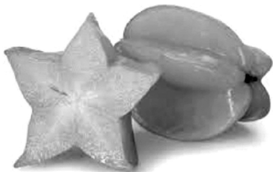
Hình 3: Minh họa bước 2

- GV: Chiếu hình ảnh tương ứng với từ (xem Hình 3).