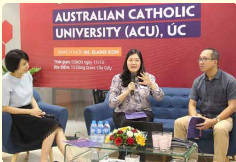
Đại diện của ACU – đối tác của FSB tham gia chia sẻ tại hội thảo do trường tổ chức

Với việc đẩy mạnh hợp tác quốc tế, FSB trông đợi mang đến những tinh hoa của nhiều nền giáo dục khác nhau cho người học, từ đó tăng cường chất lượng quốc tế hoá giáo dục của Trường.