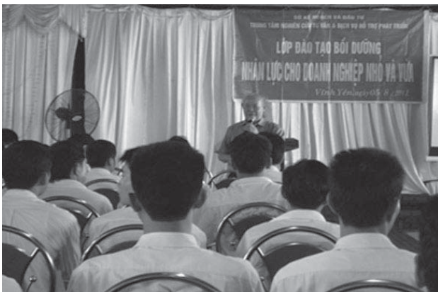
Lớp đào tạo nhân lực cho doanh nghiệp nhỏ và vừa ở Vinh Phúc