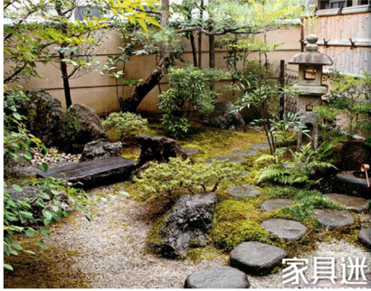
Hình 2. Vườn tự nhiên truyền thống của Nhật Bản

chung của cả hai dạng này là nhấn mạnh vẻ đẹp của sự đơn giản, tĩnh và hài hòa.