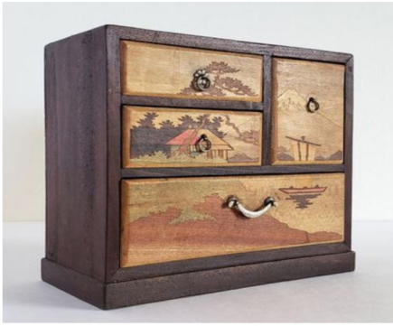
Hình 4. Một loại sản phẩm “Tansu”