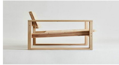
Hình 8. Ghế được thiết kế bởi Koizumi Studio

kết hợp nhiều nền văn hóa nước ngoài với sở thích thẩm mỹ, thói quen sinh hoạt và thiết kế của địa phương Nhật Bản, vừa mang đặc điểm của văn hóa Nhật Bản vừa là biểu hiện của các nền văn hóa khác.