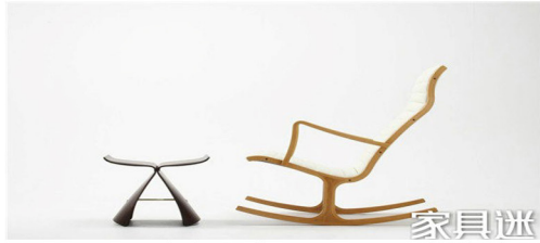
Hình 7. Ghế đầu, ghế bập bênh, được thiết kế bởi Liu Zongli