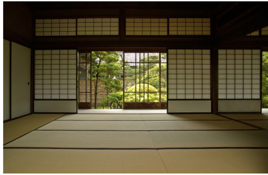
Hình 1. Không gian nội thất truyền thống Nhật Bản (cửa, vách shoji)

một quần đảo đại tầng trải dọc Thái Bình Dương ở Đông Bắc Á với các đảo chính gồm: Honshu, Shikoku và Hokkaido, bao quanh là biển và nhiều núi rừng, nơi đây, đồng thời mang đặc sắc của “nền văn minh rừng” và “nền văn minh đại dương”.