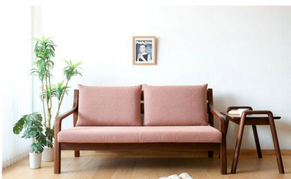
Hình 6. Ghế sofa phong cách tối giản

- Hội nhập văn hóa : Đưa sản xuất bởi công nghệ hiện đại vào ngành sản xuất đồ nội thất, thay thế sản xuất thủ công truyền thống, hòa nhập nghề thủ công hiện đại và văn hóa nội thất truyền thống. Đồng thời,