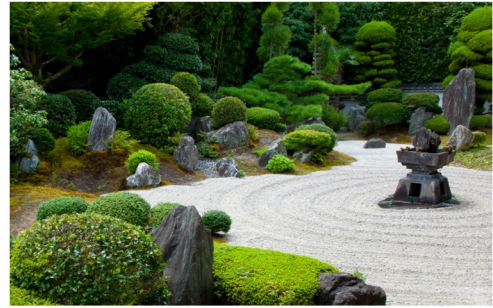
Hình 3. Khu vườn Nhật Bản trong lành và tự nhiên

Do ảnh hưởng của khí hậu, tôn giáo và môi trường tự nhiên, Nhật Bản đã hình thành nên một nền văn hóa trong không gian sống khác biệt so với Trung Quốc, Triều Tiên và Hàn Quốc, cũng như những quốc gia trong khu vực văn hóa Đông Á. Đối với Nhật Bản, nội thất và kiến trúc không chỉ không thể tách rời về không gian, mà còn là phong cách đặc sắc Nhật Bản. Gắn liền giữa tự nhiên và truyền thống đã hình thành nên