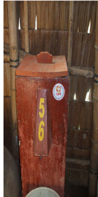
Hình 1 Bình lọc cát sinh học