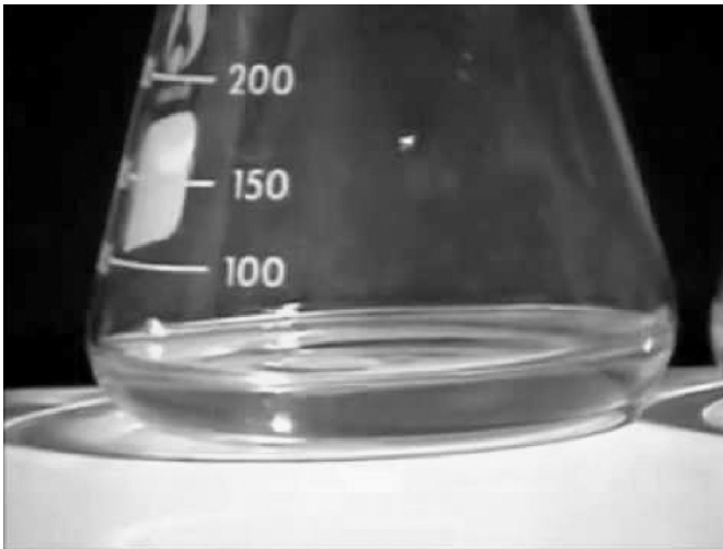
Hình 1: Phản ứng của nước với khí clo tạo thành nước clo, có tính sát trùng