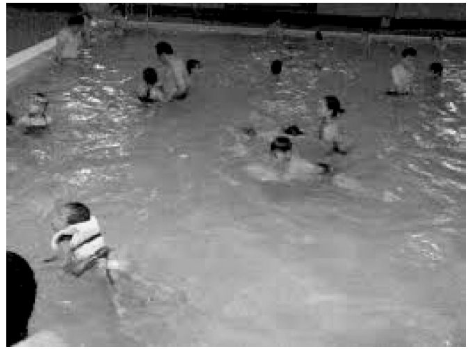
Hình 3: Sử dụng Clo hợp lý làm chất khử trùng nước trong bể bơi do nước Clo có tính chất sát trùng.