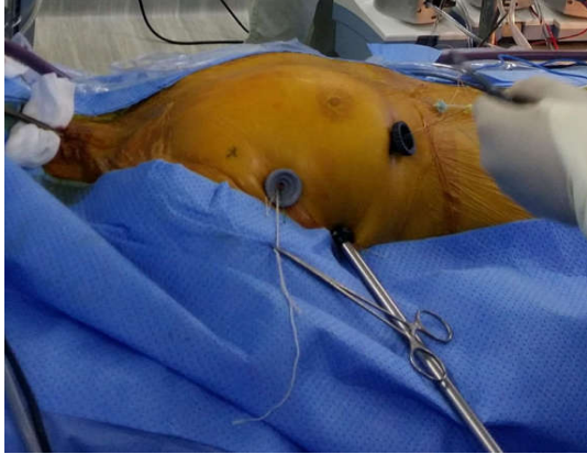
Hình 1. Vị trí các lỗ trocar