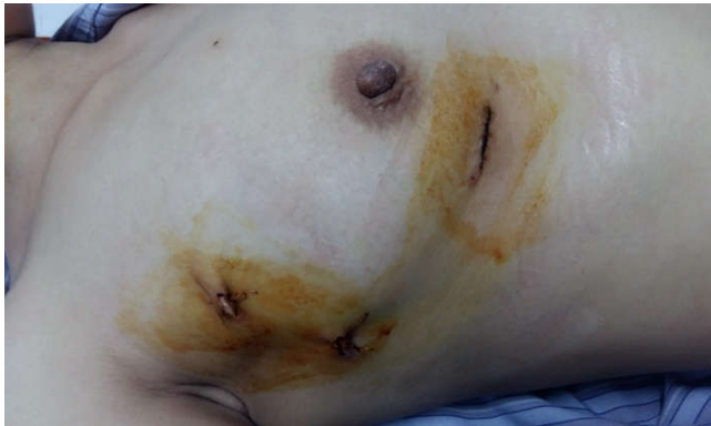
Hình 3. Sẹo mổ sau phẫu thuật

Không có tử vong bệnh viện, không bệnh nhân nào phải chuyển mổ xương ức. Khối u nhầy được lấy bỏ hoàn toàn. Thời gian mổ 3,1 \pm 0,5 giờ, chạy máy tim phổi nhân tạo 101,2 \pm 32,8 phút, thời gian nằm hồi sức 40,4 \pm 17,3 giờ, thời gian hậu phẫu 4,4 \pm 1,7 ngày. Không có biến chứng nào liên quan đến tắc mạch khí, mạch máu ngoại biên, mổ lại vì chảy máu.