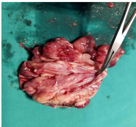
Hình 4. hình ảnh u buồng trứng sau phẫu thuật (Người bệnh số 2)