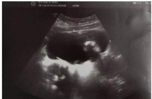
Hình 1. Hình ảnh khối u buồng trứng trên siêu âm

Sau khi hội chẩn tại Bệnh viện Bạch Mai được xét nghiệm NMDA kết quả dương tính, Các Bác sĩ quyết định sử dụng liệu pháp miễn dịch và phẫu thuật cắt bỏ u buồng trứng tại Khoa Phụ - Sản, Bệnh viện Bạch Mai. Bệnh nhân được điều trị bằng immunoglobulin để chống lại viêm não do thụ thể kháng NMDA và trải qua một cuộc phẫu thuật thành công (Hình 2).