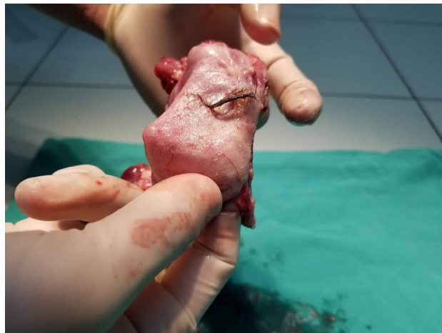
Hình 2. Hình ảnh u buồng trứng sau phẫu thuật

Sau khi hội chẩn tại Bệnh viện Bạch Mai được xét nghiệm NMDA kết quả dương tính, Các Bác sĩ quyết định sử dụng liệu pháp miễn dịch và phẫu thuật cắt bỏ u buồng trứng tại Khoa Phụ - Sản, Bệnh viện Bạch Mai. Bệnh nhân được điều trị bằng immunoglobulin để chống lại viêm não do thụ thể kháng NMDA và trải qua một cuộc phẫu thuật thành công (Hình 2).