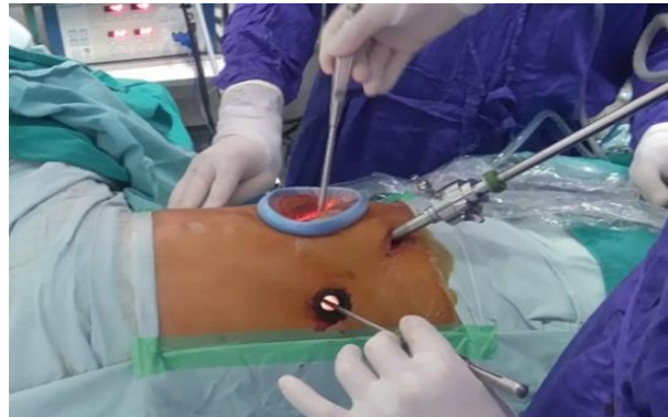
Hình 2. Vị trí đặt trocar và đường mổ ngực

- PTNS hỗ trợ: Mở ngực 8 - 10cm, vị trí KLS IV hoặc V, đường nách trước. Sử dụng banh sườn nhỏ để mở rộng KSL để có thể đưa các dụng cụ mổ mở có cán dài qua vị trí này (thường 3cm)