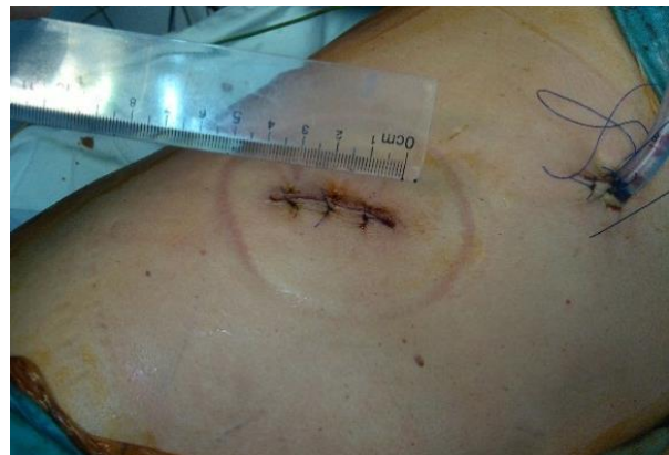
Hình 3. Kết thúc phẫu thuật