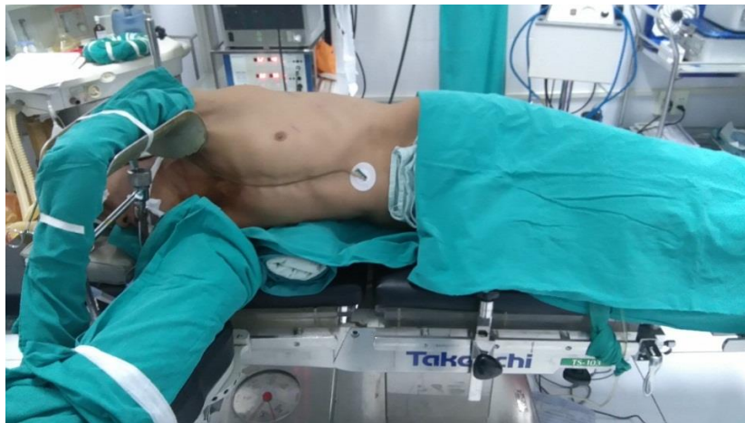
Hình 1. Tư thế bệnh nhân

+ Tư thế bệnh nhân: Nằm nghiêng 90 độ, độn gối dưới bờ sườn.