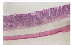
Hình 4. Hình ảnh vi thể dạ dày chuột lô 5 (VQK liều 26g được liệu/ kg) (chuột số 34), (HE x 40) .