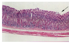
Hình 2. Hình ảnh vi thể dạ dày chuột lô 3 (uống misoprostol) (chuột số 23) (Hex 40).